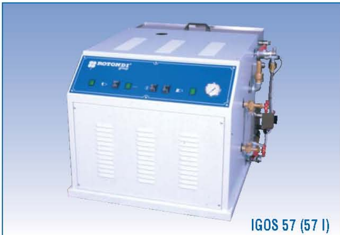
IGOS 57 (57 l)