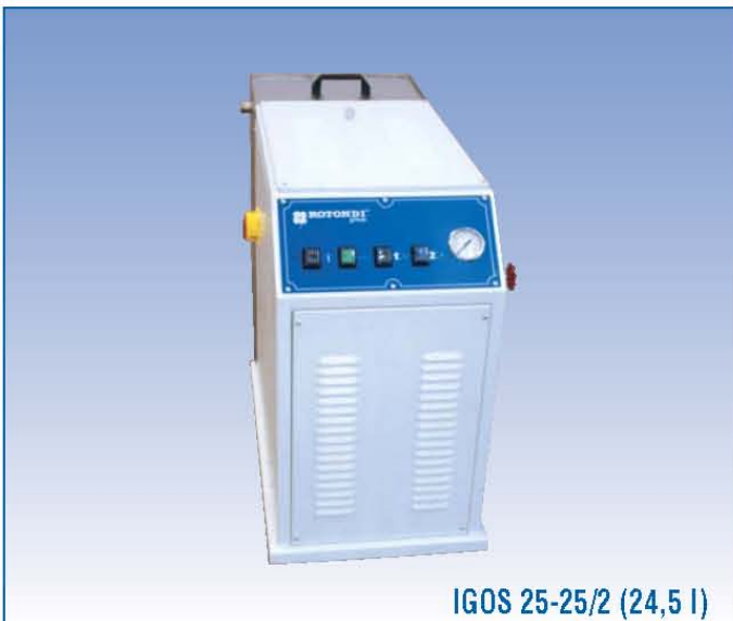
IGOS 25-25/2 (24,5 l)