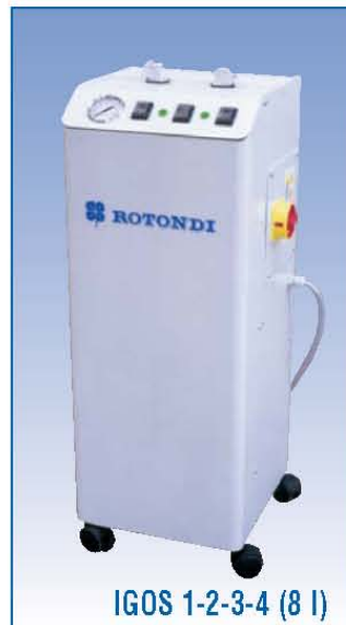
IGOS 1-2-3-4 (8 l)