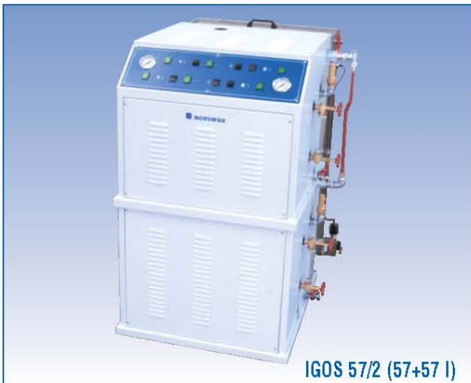
IGOS 57/2 (57+57 l)